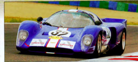
La Chevron B 16 de Nicolet/Fagionato se classe à la seconde place.

V de V Organisation, 11 chemin du Bois Bateau, 91220 Brétigny sur Orge, tél : 01 69 88 05 24, fax : 01 60 84 26 57, e-mail : info@vdev.fr