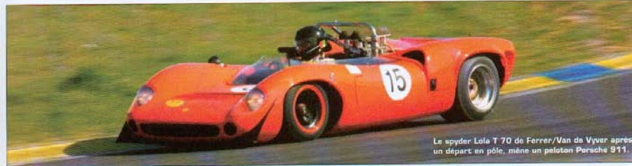
Le spyder Lola T 70 de Ferrer/Van de Vyver après un départ en pôle, mène un peloton Porsche 911.