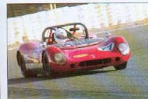
La barquette Crossle MK 8 tire son épingle du jeu (3 ème place).

1. Quiniou/Bermudes, Chevron B16 et Moreau/Langin, Porsche 911 3,0 RS, 3. Shipman/Hales, Crossle MK8 et Basseur/De Ville, De Goyet, Porsche 911 2,7 RS.