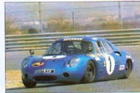
L'Alpine M 63 B de Besson/Peccolo/Dougnac se classe à la 5 ème place.