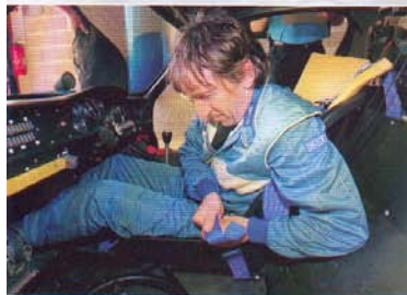
Première installation dans l'A220: émotion.