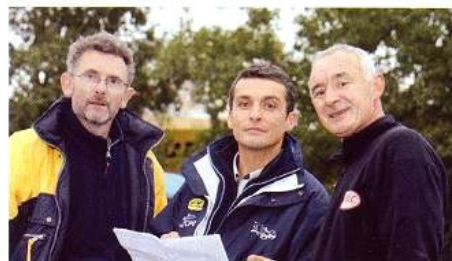
La plupart des pilotes présents sur ce cliché seront de la partie l'année prochaine au sein du Challenge, so au moins vingt-cinq concurrents.