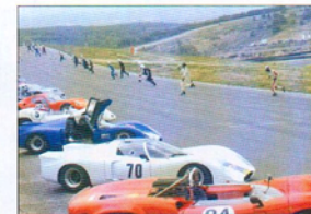
Départ en épi sous un ciel menaçant.