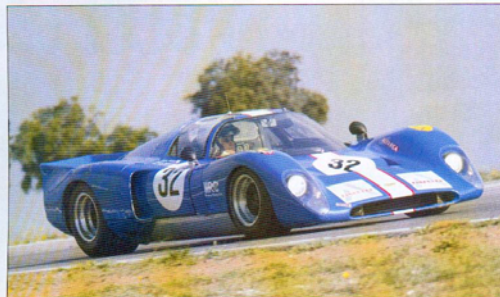
La Chevron B 16 des frères Nicolet se classe à la 8 ème place.