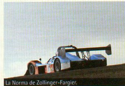
La Norma de Zollinger-Fargier.